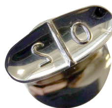
製薬用 タブレット パンチ