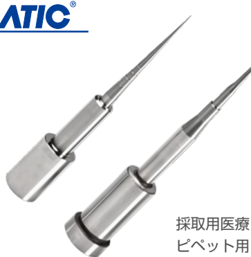
採取用医療 ピペット用 コアピン