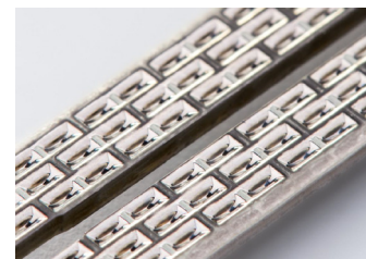
内視鏡用鉗子ジョー